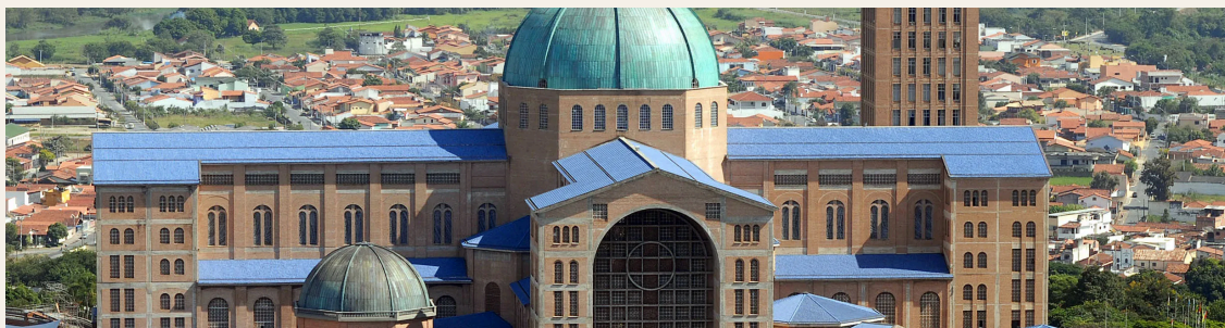
Casa da Mãe Aparecida