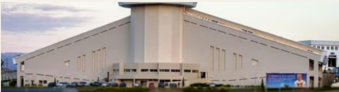
Santuário do Pai das Misericórdias